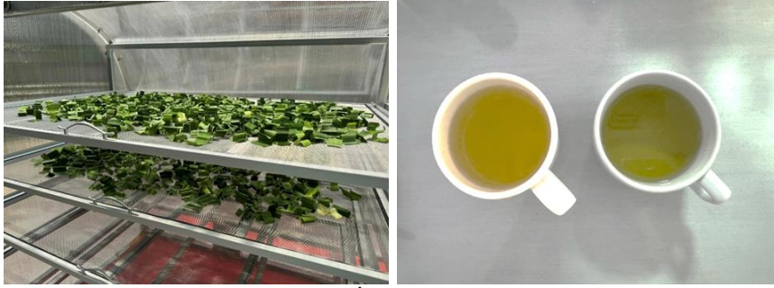
ภาพที่ 2 ชาตะไคร้