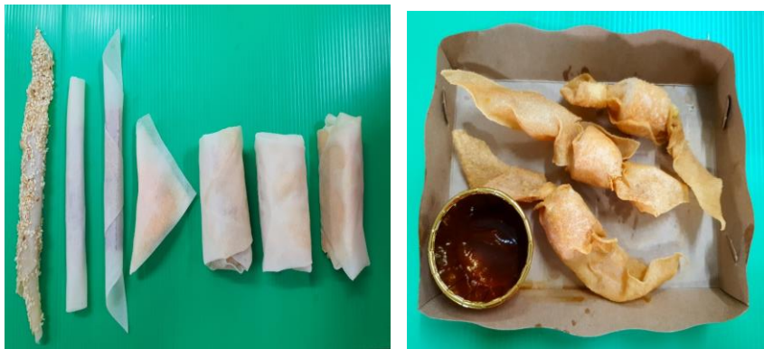
ภาพที่ 3 ปอเปี๊ยะสอดไส้ทอดกรอบ

ผู้วิจัยได้ทำการพัฒนาตราสินค้าและบรรจุภัณฑ์ร่วมกับกลุ่ม เพื่อให้ได้บรรจุภัณฑ์ที่เหมาะสมกับผลิตภัณฑ์และตราสินค้าด้วย