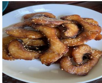
ภาพที่ 1 ปลาเส้นปรุงรส

กลุ่มวิสาหกิจน้ำพริกบ้านเนินม่วง ในการแปรรูปผลิตภัณฑ์: ชาสุมุนไพรตะไคร้ใบเตยหอม และปอเปี๊ยะสอดไส้ทอดกรอบ เป็นการแปรรูปอาหารโดยนำแผ่นปอเปี๊ยะสด/แผ่นปอเปี๊ยะแช่แข็งมาฉีกหรือพับเพื่อห่อหุ้มไส้ กลุ่มเกษตรกรนี้มีการผลิตผักและผลไม้ที่เป็นเกษตรอินทรีย์ มีหน้าร้านเป็นของตนเองและมีการรวมกลุ่มกันของกลุ่มผู้สูงอายุเป็นหลัก สามารถขายสินค้าได้เพิ่มขึ้น และเพิ่มมูลค่าให้กับสินค้าได้สูงขึ้นจนเป็นที่สนใจของกลุ่มผู้บริโภค