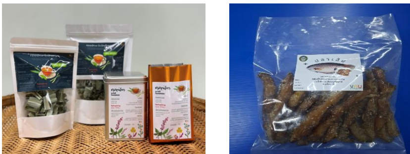
ภาพที่ 4 ตราสินค้า

ผู้วิจัยได้ทำการพัฒนาตราสินค้าและบรรจุภัณฑ์ร่วมกับกลุ่ม เพื่อให้ได้บรรจุภัณฑ์ที่เหมาะสมกับผลิตภัณฑ์และตราสินค้าด้วย