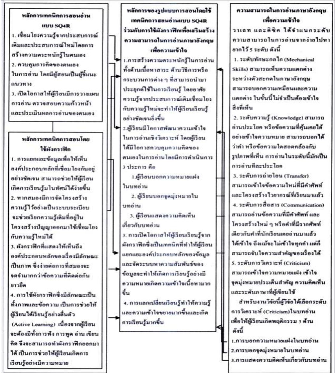
ภาพที่ 1 การสังเคราะห์หลักการของรูปแบบการสอนโดยใช้เทคนิคการสอนอ่านแบบ SQ4R ร่วมกับการใช้ผัง กราฟิกเพื่อเสริมสร้างความสามารถในการอ่านภาษาอังกฤษเพื่อความเข้าใจของนักเรียนชั้นมัธยมศึกษาปีที่ 1