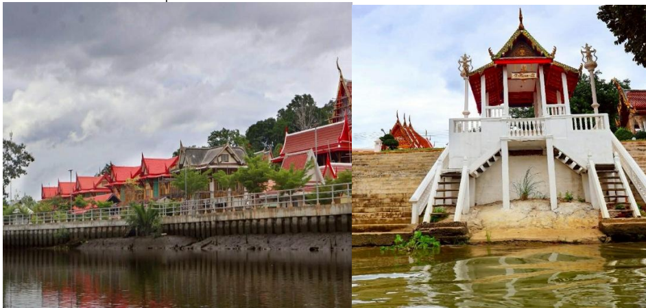
ภาพที่ 1 เส้นทางระยะยาว จากวัดมหาธาตุ อำเภอเมืองเพชรบุรี ถึง ปากอ่าวไทยที่บ้านบางตะบูน อำเภอบ้านแหลม เป็นเส้นทาง “ตามรอยสุนทรภู่”

ส่วนที่ 1 ด้านศักยภาพของชุมชน สภาพพื้นที่ในการรองรับการท่องเที่ยว ตามเส้นทางท่องเที่ยวชุมชนแม่น้ำเพชรบุรี สายน้ำแห่งประวัติศาสตร์และวัฒนธรรม ภายใต้ชีวิตวิถีใหม่มีเส้นทางท่องเที่ยวทั้ง 3 ชุมชน กับจุดเด่นในชุมชนและผ่านสถานที่สำคัญที่ดึงดูดนักท่องเที่ยว ได้แก่ หนองโสน อำเภอเมือง จังหวัดเพชรบุรี มีศาลากลางหมู่บ้าน ฉาง ใช้ในการประกอบพิธีทางศาสนา การประชุม การรวมกลุ่มของประชาชนในหมู่บ้าน สวนชมพู่เพชรสายรุ้งพันธุ์ดั้งเดิม รสชาติหวาน กรอบ การทำข้าวยาคุอาหารท้องถิ่นโบราณของเพชรบุรี บ้านกุ่มอำเภอเมือง จังหวัดเพชรบุรี มีวัดต่าง ๆ เช่น วัดขุนตรา วัดบันไดทอง วัดปากคลอง มีสถานที่แสดงถึงพหุวัฒนธรรม เช่น มัสยิด อิสลาม ศาลเจ้าจีน ชุมชนบ้านแขก ด้านประวัติศาสตร์มีด่านสวยภาชีอารจากน้ำตาลโตนด ในรัชกาลที่ 4 ณ คุ้งน้ำวัดบันไดทอง ทำน้ำทำต้นโพธิ์สถานที่ที่สุนทรภู่ขึ้นจากเรือและเขียนนิราศเขาหลวง สถานที่ตั้งพลับพลาที่ประทับของ ในหลวงรัชกาลที่ 5 บางครก อำเภอบ้านแหลม จังหวัดเพชรบุรี