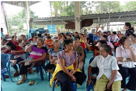
ภาพที่ 3 แสดงความคิดเห็นของสมาชิก