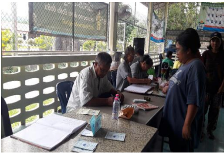
ภาพที่ 8 แสดงการฝากเงินของสมาชิก

3.4 แนวทางการส่งเสริมด้านการส่งเสริมคุณภาพชีวิต พบว่า กลุ่มออมทรัพย์เพื่อการผลิต มีการส่งเสริมคุณภาพชีวิต คือ สมาชิกมีความเป็นอยู่ที่ดีขึ้น หนี้สินน้อยลง และมีทุนในการประกอบอาชีพกลุ่มออมทรัพย์ยังเป็นการพัฒนาคุณภาพชีวิตของคนให้มีความรู้ความสามารถ และสามารถพึ่งตนเองได้