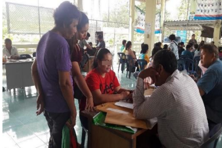
ภาพที่ 2 แสดงการให้คำปรึกษา