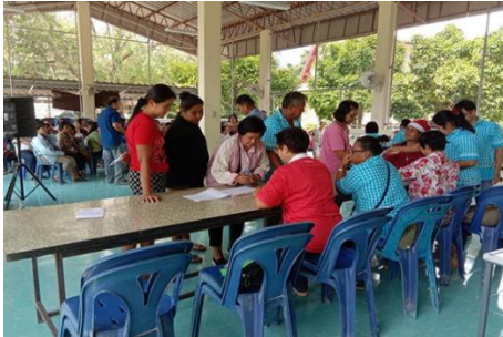
ภาพที่ 1 แสดงการร่วมมือร่วมใจกันทำงาน