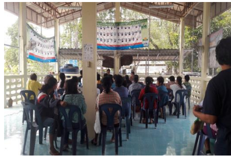
ภาพที่ 9 แสดงการแลกเปลี่ยนประสบการณ์