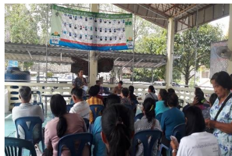
ภาพที่ 11 แสดงการพัฒนาคุณภาพชีวิตของสมาชิก