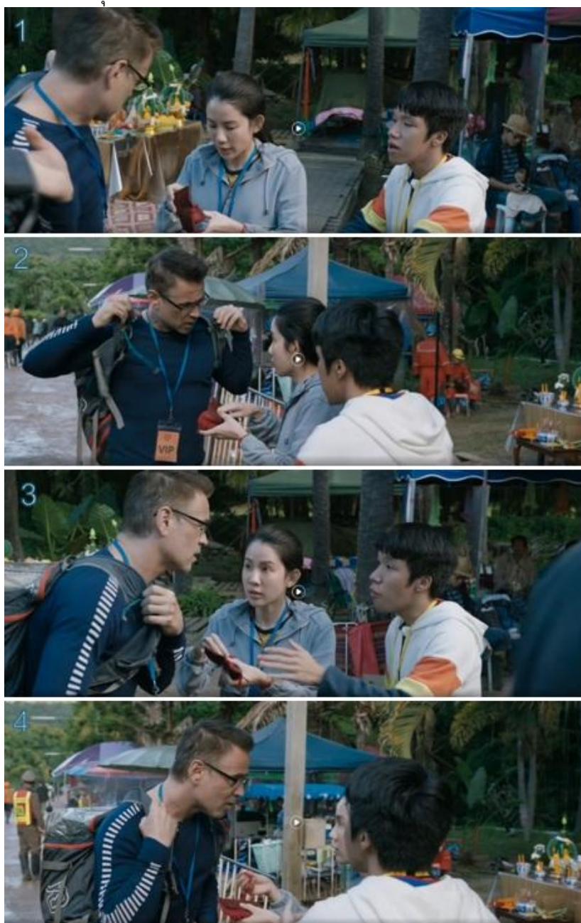
ภาพที่ 9 เทคนิคการตัดต่อแบบต่อเนื่อง (Continuity Editing)

2.4 การตัดต่อและลำดับภาพ (Editing): ภาพยนตร์ใช้เทคนิคการตัดต่อแบบต่อเนื่อง (Continuity Editing) ดังตัวอย่างในภาพที่ 9 เพื่อสร้างความสมจริงของเหตุการณ์และความต่อเนื่องของเวลา โดยเฉพาะฉากภารกิจในถ้ำที่ดำเนินอย่างราบรื่นและไม่เร่งรีบ เพื่อสะท้อนความตึงเครียดและความละเอียดอ่อนของสถานการณ์ ขณะเดียวกัน มีการใช้เทคนิคการตัดต่อแบบสลับเหตุการณ์ (Cross-cutting) เพื่อเชื่อมโยงเหตุการณ์จากหลายสถานที่ในเวลาเดียวกัน ดังตัวอย่างในภาพที่ 10 ผู้กำกับ รอน ฮาวเวิร์ดตัดสลับฉากในถ้ำกับฉากชุมชน หน่วยงาน และศูนย์อำนวยความสะดวก เพื่อสะท้อนความร่วมมือของทุกฝ่าย ฉากฝนตกหนักตัดกับภาพชาวบ้านเร่งสร้างเขื่อน แสดงให้เห็นการต่อสู้กับธรรมชาติอย่างเร่งด่วน ขณะเดียวกันมีการตัดภาพระหว่างการวางแผนในถ้ำกับการเตรียมอุปกรณ์ด้านนอกอย่างต่อเนื่อง เทคนิคนี้ช่วยเน้นย้ำว่าความสำเร็จของภารกิจเกิดจากการทำงานร่วมกันของคนหลายกลุ่มในเวลาเดียวกัน