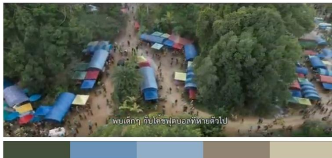
ภาพที่ 4 ฉากภายนอกถ้ำใช้โทนเย็นสีฟ้า

2.2 สี (Color): การใช้สีในภาพยนตร์ไม่ได้เป็นเพียงการตกแต่งภาพ แต่เป็นกลวิธีสำคัญในการสื่อสารอารมณ์และความหมายเชิงสัญลักษณ์ของเรื่องราว โดยผู้กำกับเลือกใช้โทนสีอย่างมีเจตนาเพื่อสร้างความแตกต่างระหว่าง “โลกภายนอก” ที่เต็มไปด้วยความหวัง กับ “โลกภายในถ้ำ” ที่เคร่งเครียดและกดดัน โทนมืดธรรมชาติ เช่น น้ำตาล เขียว เทา และน้ำเงิน ถูกนำมาใช้ในฉากภายในเพื่อสะท้อนความอึดอัด ความเยือกเย็น และความไม่แน่นอนของสถานการณ์ ขณะที่ฉากภายนอก ใช้โทนสีที่สดใสกว่า เช่น สีฟ้า สีเขียว และสีขาว สื่อถึงธรรมชาติ แสงแดด และความหวัง สร้างความรู้สึกตรงกันข้ามกับฉากภายใน ตัวอย่างเช่น ฉากเดินที่ฝ่าใบไม้สีฟ้าแสดงให้เห็นการคุมโทนสีฟ้าและสีเขียวจากต้นไม้โดยรอบ ดังในภาพที่ 4 ซึ่งสร้างความรู้สึกตรงกันข้ามกับฉากภายในอย่างชัดเจน