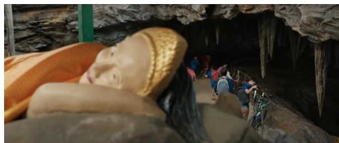
ภาพที่ 8 แสดงภาพมุมสูง (High Angle Shot)