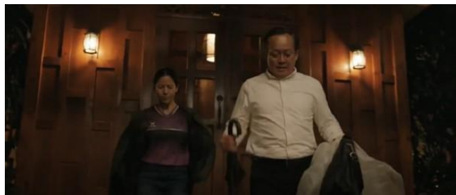
ภาพที่ 7 แสดงภาพมุมต่ำ (Low Angle Shot)

นอกจากนี้ยังมีการเคลื่อนกล้องเฉพาะในจังหวะสำคัญ เช่น ขณะนักดำน้ำเคลื่อนตัวผ่านช่องแคบในถ้ำ หรือขณะช่วยเหลือเด็ก ๆ ซึ่งช่วยเน้นความสำคัญของเหตุการณ์และสร้างความรู้สึกร่วมให้กับผู้ชม อีกทั้งยังมีการใช้มุมกล้องต่ำ (Low Angle) ดังตัวอย่างในภาพที่ 7 และมุมกล้องสูง (High Angle) ดังตัวอย่างในภาพที่ 8 ในบางฉากเพื่อสื่อถึงความเหนือกว่า ความเปราะบาง หรือความกดดันของตัวละครในสถานการณ์เฉพาะ การจัดวางกล้องและการเคลื่อนไหวจึงมีบทบาทสำคัญในการกำหนดจังหวะของเรื่องและการสื่อสารอารมณ์ผ่านภาพอย่างมีประสิทธิภาพ