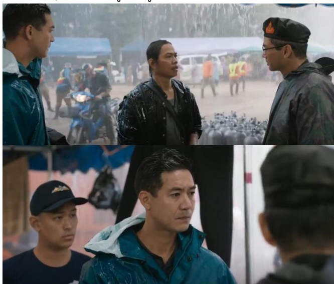
ภาพที่ 3 การจัดแสงแบบ Side Light แสดงความรู้สึกว่าผู้แสดงมีความอ่อนแอ

จากภาพที่ 2 แสดงได้ว่านายริก สแตนตัน นักดำน้ำชาวอังกฤษที่กำลังช่วยคนงานออกจากถ้ำ ในระหว่างปฏิบัติการกิจเข้าช่วยเหลือทีมหมูป่าอคาเดมี โดยฉากนี้ได้มีการจัดแสงแบบ โลว์คีย์ ใช้โทนมืดของผนังถ้าสะท้อนแสงไปยังตัวบุคคล เงานี้มีตมมากกับแสงสว่างที่ส่องมาจากด้านหลังของบุคคลนั้นสื่อให้เห็นถึงความยากลำบาก ทั้งการต่อสู้กับสภาพจิตใจของตนและความกดดันจากภัยธรรมชาติ การใช้แสงตามทิศทางช่วยเน้นอารมณ์ของตัวละครในช่วงเวลาสำคัญ เช่น ความลังเล ความกลัว หรือความมุ่งมั่นในการตัดสินใจ รวมถึงการจัดแสงในลักษณะนี้ไม่เพียงแต่ช่วยสร้างบรรยากาศของเรื่องเท่านั้น แต่ยังทำหน้าที่เป็นภาษาภาพยนตร์ที่สื่อความรู้สึกภายในของตัวละครอย่างลึกซึ้งและมีนัยสำคัญต่อการรับรู้ของผู้ชม