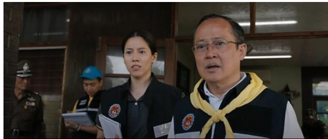
ภาพที่ 6 แสดงระยะภาพของ MS (Medium Shot)

2.3 การกำกับการถ่ายภาพ (Cinematography): ภาพยนตร์ใช้มุมกล้องแบบปานกลาง (Medium Shot) เป็นหลัก ดังตัวอย่างในภาพที่ 6 ผู้กำกับ รอน ฮาวเวิร์ด ได้เลือกใช้ MS (Medium Shot) ซึ่งเป็นระยะที่เห็นครึ่งตัวของตัวละครมากที่สุด เพื่อรักษาระยะห่างที่สมจริงและสื่อสารสถานการณ์โดยไม่เร้าอารมณ์จนเกินไป เพื่อให้เห็นการกระทำและอารมณ์ของตัวละครอย่างชัดเจน โดยเฉพาะในฉากที่มีการสนทนา การตัดสินใจ หรือการปฏิบัติภารกิจ ซึ่งช่วยให้ผู้ชมสามารถเชื่อมโยงกับตัวละครได้อย่างใกล้ชิด