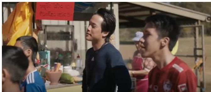
ภาพที่ 1 การใช้แสงแบบไฮคีย์ ช่วยส่งเสริมให้บรรยากาศดูมีพลังบวก

2.1 แสงและเงา (Light and Shadow): ภาพยนตร์ใช้แสงแบบ High Key ในฉากภายนอก เช่น บริเวณศูนย์บัญชาการและพื้นที่ชุมชน เพื่อสื่อถึงความหวังและความปลอดภัย ขณะที่แสงแบบ Low Key ในฉากภายในถ้ำ เช่น ขณะดำเนินการกู้ภัย ช่วยสร้างความตึงเครียดและความไม่แน่นอน และความรู้สึกปิดล้อม สะท้อนสภาพแวดล้อมที่อันตรายและความเปราะบางของสถานการณ์