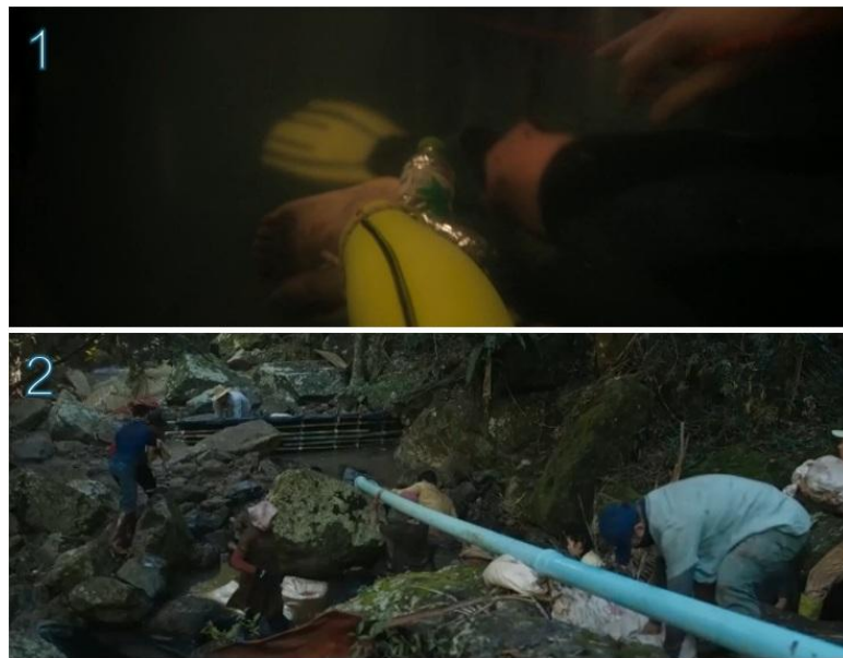
ภาพที่ 10 เทคนิคการตัดต่อแบบสลับเหตุการณ์ (Cross-cutting)