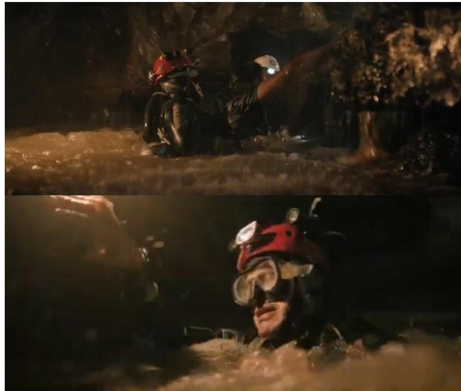
ภาพที่ 2 การจัดแสงแบบ โลว์คีย์ ใช้โทนมืดของผนังถ้าสะท้อนแสงไปยังตัวบุคคล

จากภาพที่ 1 อธิบายได้ว่า โค้ชเอกที่กำลังมองเด็ก ๆ อยู่จากด้านหลังอย่างเอ็นดู หลังตั้งใจฝึกซ้อมฟุตบอลในช่วงบ่าย โดยฉากนี้มีการใช้แสงแบบไฮคีย์ มีการจัดแสงด้วยอุปกรณ์ HMI สำหรับเพิ่มความแรงของแสงไปยังตัวบุคคล เพื่อให้เห็นถึงบรรยากาศที่มีพลังบวกและแรงบันดาลใจแก่เด็ก ๆ ในการฝึกซ้อมฟุตบอลอย่างตั้งใจ