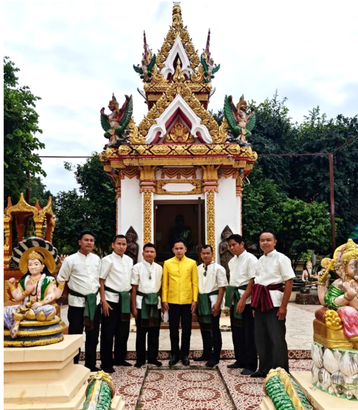
ภาพที่ 1 การแต่งกายที่เหมาะสมตามกาลเทศะ

กรณีที่เป็นพิธีกรรมทางศาสนา จะเรียกว่า “ศาสนพิธีกรรม” ซึ่งหมายถึงผู้ทำหน้าที่ควบคุมและปฏิบัติศาสนพิธีให้ถูกต้องตาม พิธีกรรมทางศาสนาตลอดจนประสานงานเพื่อให้การดำเนินกิจกรรมในพิธีนั้น ๆ เป็นไปด้วยความเรียบร้อย คุณสมบัติ ของศาสนพิธีกรรมจะต้องมีความรู้ความสามารถในการปฏิบัติศาสนพิธี มีไหวพริบ ปฏิภาณ ตัดสินใจ และแก้ไขข้อขัดข้อง ได้รวดเร็วและเรียบร้อย มีความแม่นยำ ละเอียด รอบคอบ การแต่งกายและปฏิบัติตนให้เหมาะสมตามกาลเทศะ มีมารยาทเรียบร้อย และสามารถประสานงาน ควบคุม กำกับพิธีกรรมได้ ตัวอย่างการแต่งกาย ดังภาพที่ 1