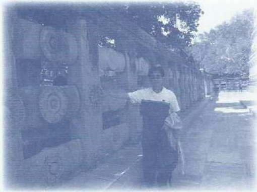
• รั้วรอบพระมหาวิหารทำขึ้นใหม่เลียนแบบของเก่าที่สร้างขึ้นในสมัยพระเจ้าอโศกมหาราช