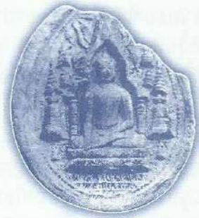
• พระพิมพ์ดินเผา ศิลปะอินเดียสมัยราชวงศ์ปาละ อายุราวพุทธศตวรรษที่ ๑๕-๑๖ พบที่ระฆังมัมปุระ (Raghurampur)

ยอดทั้ง ๕ เหนือเรือนธาตุประดับด้วยปูนปั้นเช่นกัน โดยลวดลายเครื่องประดับบนยอดกลางแบ่งเป็นแนวนอน ๙ แนวซ้อนกัน แต่ที่ยอดอื่น ๆ ซึ่งมีขนาดย่อมกว่าแบ่งออกเป็น ๖