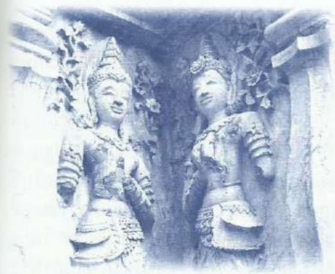
• ลวดลายปูนปั้นที่ประดับบนผนังพระวิหาร

ประธานประจำวิหาร บริเวณกึ่งกลางฝาผนัง ด้านในห้องโถงเจาะเป็นช่องแคบ ๆ มีบันไดทอดตัวขึ้นไปข้างบนออกสู่หลังคาวิหาร ซึ่งเป็นหลังคาทรงตัดลักษณะคล้ายดาบฟ้าทั่วไป พื้นที่เป็นที่ตั้งของปราสาทยอดเจดีย์แบบพุทธคยา ในอินเดียจำนวนห้ายอด (และมีเจดีย์ทรงกลมขนาดเล็กอีก ๒ องค์ ตั้งอยู่เหนือมุขด้านทิศตะวันออก จึงเป็นที่มาของชื่อวัดเจ็ดยอด) บนลานทางทิศตะวันตกของเรือนธาตุมีหลุมสี่เหลี่ยมจัตุรัสสำหรับปลูกต้นไม้เหมือนกับที่มหาวิหารที่เมืองพุกาม