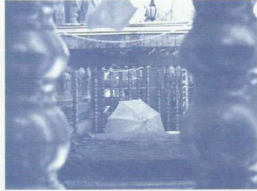
• พระแท่นนชิรธาสน์

การตกแต่งเป็นลวดลายคล้ายกุฏ (ลักษณะเป็น ชูมวงโค้งรูปเกือกม้า) ประดับอยู่ทุกชั้นทั้งสี่ด้าน เจดีย์ทั้ง ๕ นี้มีทางเดินหรือระเบียงเชื่อมต่อกัน เป็นรูปกากบาท ที่บริเวณฐานของเจดีย์ซึ่งมี ขนาดค่อนข้างสูง ทุกด้านมีชุ้มหรือคูหา ประดิษฐานพระพุทธรูปและรูปพระโพธิสัตว์ รวมทั้งเทพธิดาหรือนางดารา ซึ่งเป็นรูปเคารพ ตามคติความเชื่อของพุทธศาสนamahayana ปรากฏ อยู่ นอกจากนั้น บริเวณระเบียงพระวิหารยังมี สถูปใหญ่น้อยที่สร้างขึ้นตามแบบสกุลช่างคุปตะ และสกุลช่างปาละตั้งอยู่เรียงรายอยู่โดยรอบ