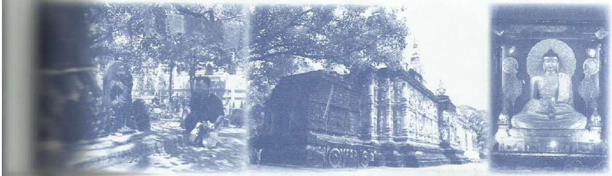
• ต้นพระศรีมหาโพธิ์