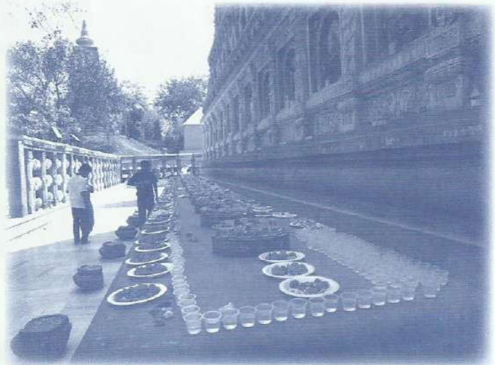
● รัตนางกรมเจดีย์ ซึ่งหลงเหลือร่องรอยเพียงเชิงเสารูปหม้อน้ำสลักลายกลีบบัว ตั้งอยู่บริเวณด้านทิศเหนือของพระมหาวิหาร

สำหรับตัวมหาวิหารนั้น นักวิชาการบางท่านสันนิษฐานว่าคงสร้างขึ้นราวพุทธศักราช ๖๗๔ ในรัชสมัยของพระเจ้าฮุวิษกะ (Huvishka) แห่งราชวงศ์กุษาณะ (Kushana) โดยมีพระพุทธรูปที่เคยประดิษฐานอยู่ในซุ้มเหนือแท่นวัชรอาสน์องค์เดิมซึ่งเชื่อกันว่าสร้างขึ้นในช่วงเวลาดังกล่าวปรากฏเป็นหลักฐาน ๑ หลังจากนั้นก็ได้ปรากฏการสร้างถาวรวัตถุเพิ่มเติมอีกต่อมาเป็นระยะ เช่น ในสมัยราชวงศ์คุปตะ (Gupta) ราวพุทธศตวรรษที่ ๙-๑๑ ได้มีการสร้างสถูปและพระพุทธรูปตามแบบสกุลช่างคุปตะประดิษฐานไว้ที่ชั้นบนของระเบียงเจดีย์ และในสมัยราชวงศ์ปาละ (Pala) ราวพุทธศตวรรษที่ ๑๔-๑๖ มีการก่อสร้างและปฏิสังขรณ์ถาวรวัตถุเพิ่มเติม ได้แก่ ยอดพระวิหารทั้ง ๕ ยอด รวมทั้งพระพุทธรูปและรูปพระโพธิสัตว์ต่างๆ ที่ประดิษฐานอยู่ในคูหาหรือซุ้มที่ฐานของพระเจดีย์ ซึ่งสร้างขึ้นตามคติความเชื่อทางพุทธศาสนาฝ่ายมหายานที่เป็นที่นับถือของราชวงศ์ปาละ ราชวงศ์กษัตริย์ที่เคยมีอำนาจทางการเมืองและศาสนาในแคว้นพิหารและเบงกอลในช่วงเวลานั้น