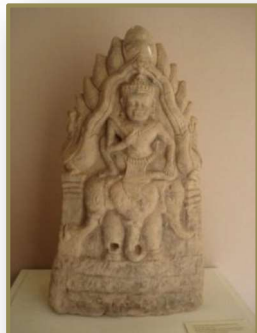
กลีบบนฐานภาพพระอินทร์ทรงช้างเอราวัณ พิพิธภัณฑ์สถานแห่งชาติ สุรินทร์

นอกจากนี้ ยังได้พบประติมากรรมจำหลักประดับสถาปัตยกรรมอีกจำนวนหนึ่ง ส่วนมากเป็นกลีบบนฐานจำหลักรูปเทพเจ้าประจำทิศ ฤๅษี ครุฑและนาค ซึ่งมีความสัมพันธ์กับคติเรื่องจักรวาลตามความเชื่อในศาสนาฮินดู