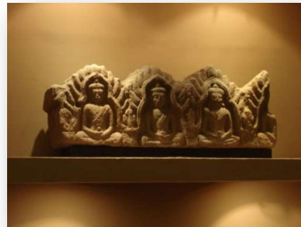
พระพุทธรูปปางสมาธิ พิพิธภัณฑสถานแห่งชาติสุรินทร์

สำหรับประติมากรรมจำหลักประดับสถาปัตยกรรมในพุทธศาสนาพบน้อย ที่มีหลักฐานได้แก่ พระพุทธรูปปางสมาธิ พบที่ปราสาทยายเหงาและปราสาทตาเมือน องค์ที่พบที่ปราสาทยายเหงา ลักษณะเป็นพระพุทธรูปนั่ง พระพักตร์แสดงอาการยิ้มพระวรกายค่อนข้างสั้นและสมบูรณ์ ส่วนองค์พบที่ปราสาทตาเมือน เป็นพระพุทธรูปปางสมาธิประทับนั่งภายในซุ้ม พระพุทธรูปสวมกระบังหน้า มงกุฎ ทรงกรวย กรอบซุ้มทำเป็นเส้นโค้งประกอบลายดอกไม้ตั้งขึ้น ลักษณะเป็นส่วนประกอบสถาปัตยกรรม ซึ่งใช้ประดับบริเวณสันหลังคาของอาคารหรือกำแพงศาสนสถาน นอกจากนี้ ยังมีพระพุทธรูปปางสมาธิ ซึ่งไม่ทราบที่มา จัดแสดงในพิพิธภัณฑสถานแห่งชาติ สุรินทร์