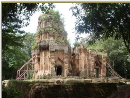
ปราสาทยายเหงา อ.สังขะ จ.สุรินทร์

ปราสาทยายเหงา ตำบลสังขะ อำเภอสังขะ จังหวัดสุรินทร์ เป็นปราสาทก่อด้วยอิฐ 2 องค์ มีลักษณะเหมือนกัน คือ มีแผนผังรูปสี่เหลี่ยมจัตุรัส หันหน้าไปทางทิศตะวันออก มีประตูทางเข้า-ออกทางด้านหน้าประตูเดียว ส่วนยอดทำเป็นชั้นหลังคาซ้อนกันขึ้นไป มีคูน้ำรูปตัวยูล้อมรอบ