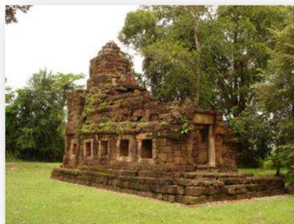
ปราสาทตาเมือน อ.พนมดงรัก จ.สุรินทร์

ธรรมศาลา หรือที่พักคนเดินทาง ถูกสร้างขึ้นตามเส้นทางที่สำคัญ มีรูปแบบผังเหมือนกันทุกแห่ง คือ เป็นปราสาทหลังเดี่ยวก่อสร้างด้วยศิลาแลงและหินทรายที่มีห้องยาวยื่นมาด้านหน้า มีหน้าต่างเฉพาะผนังด้านทิศใต้ ที่พบในจังหวัดสุรินทร์มีจำนวน 1 แห่ง คือ ปราสาทตาเมือน อำเภอพนมดงรัก และคงเป็น 1 ในจำนวน 17 แห่ง ที่พระเจ้าชัยวรมันที่ ๗ โปรดให้สร้างขึ้นจากเมืองพระนครไปยังเมืองพิมายบนที่ราบสูงโคราชในประเทศไทย (ดุสิต ทุมมาภรณ์. 2551 : 73)