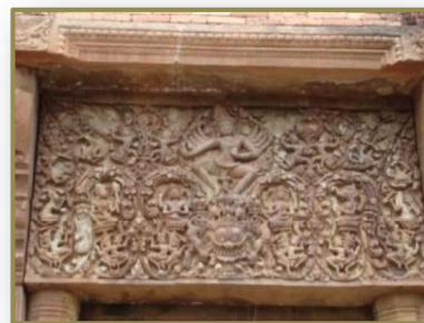
ทับหลังปราสาทศีขรภูมิ อ.ศีขรภูมิ จ.สุรินทร์

ศิวนาฏราชเป็นปางหนึ่งของพระศิวะที่ทรงพ้อนรำในอาการเคลื่อนไหว บางครั้งเรียกว่า “นฤตตมูติ” เป็นเหตุการณ์สำคัญตอนหนึ่งตามคติความเชื่อในศาสนาฮินดู โดยเชื่อว่าการพ้อนรำของพระศิวะเป็นทั้งการสร้างและทำลายโลกไปพร้อมกัน การพ้อนรำของพระองค์มีอยู่ด้วยกันหลายครั้ง ซึ่งเกิดขึ้นในโอกาสต่าง ๆ กันและมีความหมายต่างกัน ซึ่งภาพจำหลักรูปพระศิวนาฏราชที่ปรากฏเป็นภาพประธานอยู่บริเวณตอนกลางของทับหลังด้านทิศตะวันออกของปราสาทศีขรภูมิ คงมีความหมายถึงการพ้อนรำบนสรวงสวรรค์ ณ ยอดเขาไกรลาส