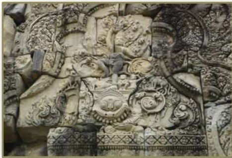
หน้าบันปราสาทบ้านพลวง จำหลักลายรูปกฤษณะโควรวรณะ

เหตุการณ์เกี่ยวกับพระกฤษณะที่สำคัญอีกครั้งหนึ่ง ได้แก่ เหตุการณ์ตอนกฤษณะโควรวรณะ หรือพระกฤษณะยกภูเขาโควรวรณะ ตามเนื้อเรื่องว่าวันหนึ่งขณะที่พระกฤษณะประทับอยู่กับพระเชษฐา พลรามภายในสวนของนันทะ พระองค์ได้ทอดพระเนตรเห็นคนเลี้ยงโคกำลังเตรียมพิธีบูชาญญถวายแด่พระอินทร์ พระกฤษณะได้ทรงระงับไว้โดยบอกคนเหล่านั้นว่าพวกเขาควรจะทำพิธีบูชาภูเขาโควรวรณะ เนื่องจากเป็นสถานที่ให้ชีวิต เป็นที่อยู่อาศัยและทำมาหากิน ดีกว่าจะบูชาพระอินทร์ที่ไม่เคยทำอะไรแก่พวกเขาเลย ซึ่งพระองค์ได้เป็นผู้รับเครื่องบูชาเหล่านั้น ฝ่ายพระอินทร์จึงทรงพิโรธและแค้นโดยทำให้พายุฝนตกลงมาในสวนของนันทะ พระกฤษณะทรงถอนภูเขาโควรวรณะแล้วยกขึ้นด้วยพระหัตถ์เพียงข้างเดียวให้ลอยอยู่ในอากาศ เพื่อปกป้องคนเลี้ยงโคและฝูงสัตว์ให้พ้นจากแรงโทสะของพระอินทร์ โดยมีได้ทรงขยับเขยื้อนพระวรกายเลยเป็นเวลาเจ็ดวันจนกระทั่งพระอินทร์ได้ตระหนักถึงอำนาจของพระองค์และยอมแพ้ไปในที่สุด (สุริยวุฒิ สุขสวัสดิ์. 2539 : 356-357)