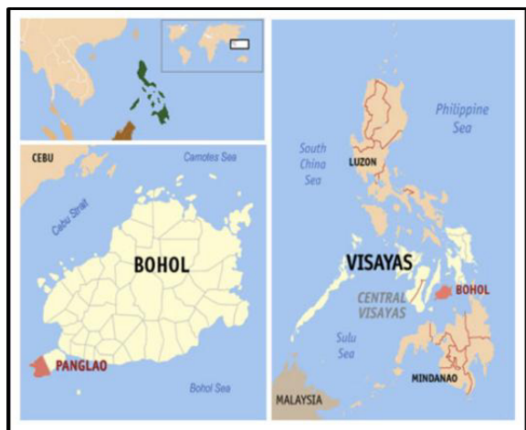
Figure 1. Location of the Bohol in the Philippines

analytical knowledge, which can inform policy discussions and suggest solutions applicable to similar rural areas in the Philippines (Stake, 1995; Flyvbjerg, 2011). The areas studied are shown in Figure 1.