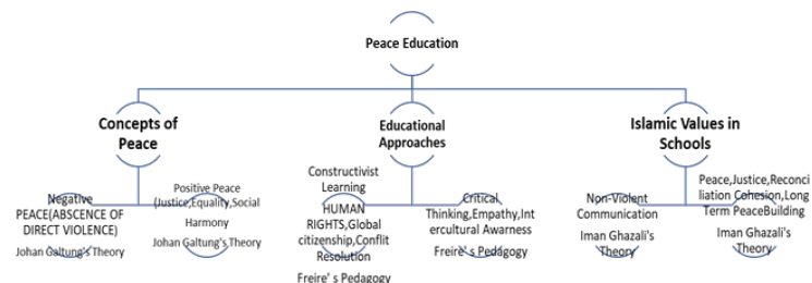
Figure 1. The theoretical framework for peace education.

This model aims to create sustainable peace by addressing systemic issues, fostering critical agency, and nurturing individual transformation, particularly in contexts like the Deep South of Thailand.