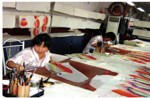
แผนภาพที่ 7 : ว่าวทำมือจากสวนศิลปะพื้นบ้าน Yangjiabu