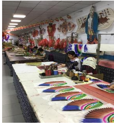
แผนภาพที่ 9 : ว่าวทำมือที่ผลิตในสถานที่จากพิพิธภัณฑ์ว่าวเว่ยฟาง