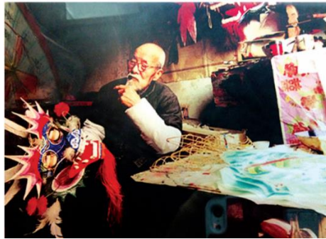
แผนภาพที่ 6 : ศิลปินว่าวชาตง หยาง ตงเกอ จากหนังสือว่าว