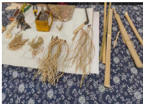
แผนภาพที่ 5 : วัสดุว่าวไม้ จากวิทยานิพนธ์ปริญญาโทของมหาวิทยาลัยชิงเต่า

1. ศึกษาประวัติและวิเคราะห์ลักษณะงานหัตถกรรมว่าวเงินในหมู่บ้านหยางเจี๋ยบู เมืองเว่ยฟาง มณฑลซานตง ผลการศึกษาด้านประวัติศาสตร์หมู่บ้านหยางเจี๋ยบูพบว่าเป็นแหล่งกำเนิดของว่าวเว่ยฟาง ในช่วงต้นราชวงศ์หมิง ตระกูลหยางได้เริ่มทำว่าวขึ้นก่อน ในช่วงกลางของราชวงศ์หมิง ศิลปินหยางเจี๋ยบู ได้มีการผสมผสานรูปภาพปีใหม่และว่าวเข้าด้วยกัน สร้างภาพวาดผูกแปะว่าว สไตลว่าวหยางเจี๋ยบู นั้นมีเอกลักษณ์เฉพาะตัวเกิดขึ้น หนึ่งในสี่โรงเรียนหลักในสาธารณรัฐประชาชนจีนที่ทำว่าวคือ ในกรุงปักกิ่ง เทียนจิน และหนานทง สำหรับรูปแบบของว่าวหยางเจี๋ยบูเริ่มจากวัสดุที่ยังใช้ไม้ไผ่นำมาทำเป็นโครง รูปแบบดั้งเดิมเป็นพัฒนาการจากการแกะไม้งานปีใหม่ขึ้นก่อน รูปแบบที่นิยมสร้างสรรค์ตัวอย่างได้แก่รูปมังกรเป็นสัตว์ในตำนานความเชื่อแต่โบราณ การสร้างสรรค์ทั้งหมดทำด้วยมือเป็นหลักสำคัญ (ดูแผนภาพที่ 5-9 ประกอบ) การทำว่าวด้วยมือยังพบว่ามีการทำอยู่หลายครอบครัวในพื้นที่ มีการสืบทอดเป็นตระกูล ตัวอย่าง Yang Tongke (แผนภาพที่ 6) เกิดในครอบครัวที่วาดภาพว่าวปีใหม่ มีความอ่อนไหวและขยันขันแข็งมาตั้งแต่เด็ก เมื่ออายุ 10 ขวบ เขาได้รับการสอนโดยปรมาจารย์ว่าว Yang Dianjun เมื่อเขาอายุ 11 ปี เขาเล่นว่าวกับลูกหยาง เจิ้น อายุ 12 ปี เขาสามารถทำงานอิสระได้ จนเมื่ออายุ 17 ปี เขายังพิมพ์ภาพปีใหม่ และกลายเป็นสินค้าที่เป็นที่ต้องการด้วย