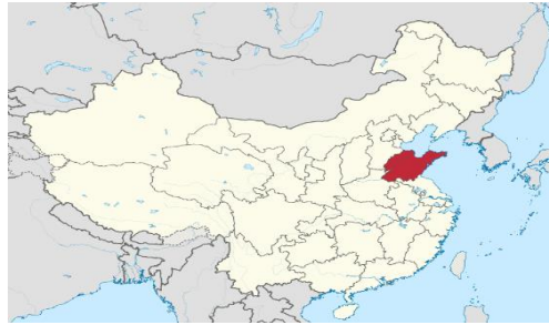
แผนภาพที่ 1 : แผนที่ตั้งงาน