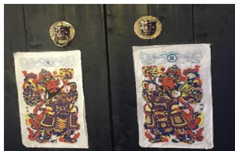
แผนภาพที่ 2 : บุรุษในหยางเจียบู ภาพปีใหม่ ชาหยูเล่ย์และพระเจ้า