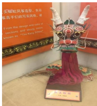
แผนภาพที่ 8 : ว่าวตะขาบหัวมังกรจากสวนศิลปะพื้นบ้านหยางเจี๋ยบู