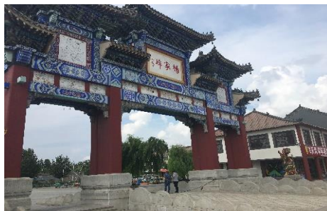
แผนภาพที่ 3 : สถานที่ท่องเที่ยวหยางเจียบู ประตูดงชมิว